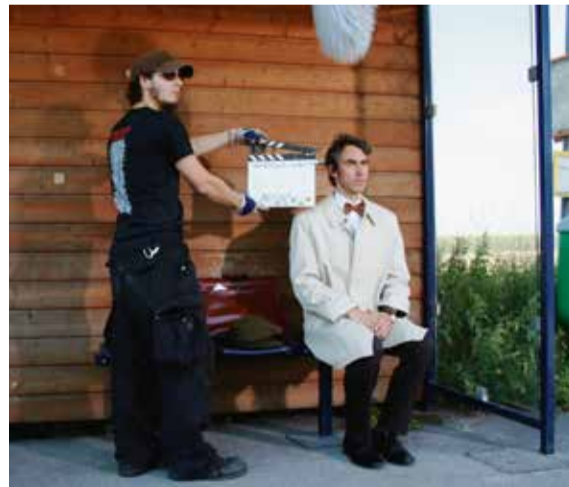
Start für den Master „Sound“ im Fachbereich Design.

Besonderes Ziel ist es auch, die Masterstudierenden für eine unternehmerische Selbstständigkeit möglichst in Dortmund zu professionalisieren. Voraussetzung dafür ist eine Ausdehnung des Kompetenzspektrums über den Bereich des Film-Sound-Designs hinaus. Dazu widmen sich drei Fachmodule den