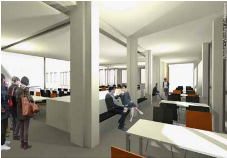
Die Arbeitsplätze im Neubau ersetzen die Plätze in der Schwarzen Mensa.