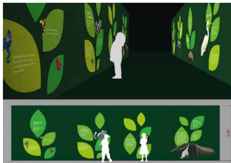
Ein Gestaltungsvorschlag der chinesischen Studentin Mingyu Cheng.

Die Gestaltungsideen sind unter dem Titel „szeno mio!“ ab dem 15. April bis zum 16. Mai im Kindermuseum „mondo mio!“ an der Florianstraße 2 ausgestellt. Für die Ausstellungs-Eröffnung hat sich Vesela Stanoeva (Bulgarien) einen besonderen Hingucker ausgedacht: Die