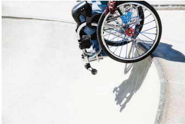
Eine Handbreit vom Abgrund entfernt – Mut oder Leichtsinns?

Berufstätige, die parallel zum Job etwas für ihre Karriere tun möchten, haben dazu ab dem kommenden Herbst wieder Gelegenheit: Im Rahmen der Verbundstudiengänge Wirtschaftsinformatik bieten die FH Dortmund und die TH Köln, Campus Gummersbach, ab dem Wintersemester 2016 wieder die Möglichkeit an, neben Beruf und Familie einen Bachelor- oder Master-Abschluss zu erwerben. Eine Informationsveranstaltung zu den Verbundstudiengängen Wirtschaftsinformatik findet am Samstag, 21. Mai 2016, an der Fachhochschule Dortmund statt. Eine Online-Anmeldung ist erforderlich unter: www.verbundstudium.de/informationen/termine . Die Studiengänge machen fit für Positionen in der Entwicklung und Anwendung betrieblicher und administrativer Informations- und Kommunikationssysteme. Der Bachelor-Studiengang vermittelt fundiertes Fach- und Methodenwissen der Wirtschaftsinformatik. Im Mittelpunkt des konsekutiven Master-Studiengangs steht die Qualifizierung für Führungsaufgaben im IT-Bereich. Durch die spezielle Kombination von Fernstudienanteil (75 Prozent) und Präsenzveranstaltungen (etwa alle 14 Tage samstags) lassen sich Studium, Beruf und Familie gut miteinander vereinbaren. Weitere Informationen: www.fh-dortmund.de/vbw