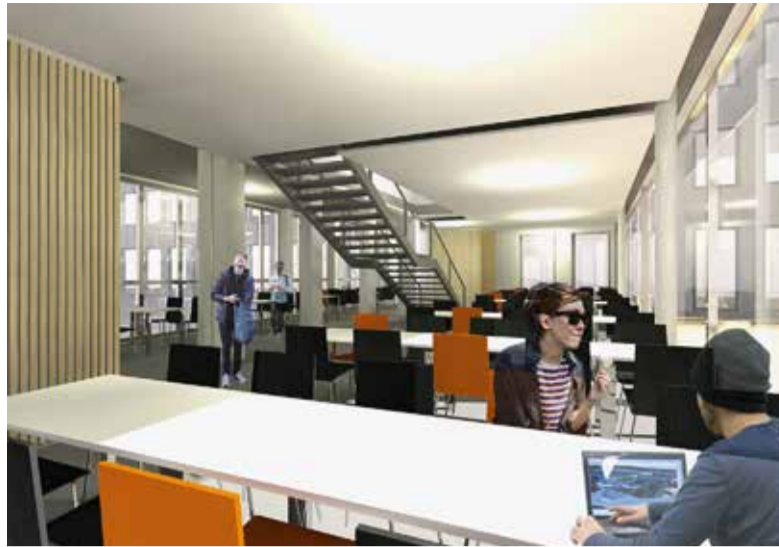
Der neue Gebäudeteil bietet viel Platz für konzentriertes Arbeiten.