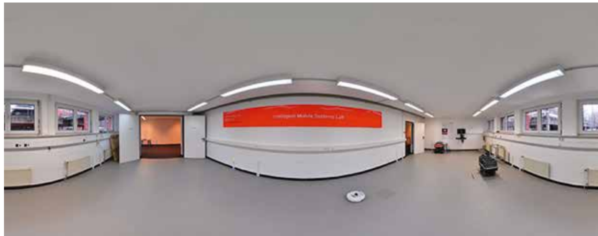
In der Panorama-Ansicht: Das Intelligent Mobile Systems Lab an der Otto-Hahn-Straße 23, einem weiteren Standort der Fachhochschule im TechnologiePark.

Im Labor an der Otto-Hahn-Straße sind auf rund 80 Quadratmetern nahezu 1000 RFID-Tags engmaschig verlegt worden. Bewegt sich ein Roboter darüber, kann die ID der Tags und damit die jeweilige Position über ein Lesegerät herausgelesen werden“, sagt Röhrig. Im Rahmen seiner Forschungen entwickelt