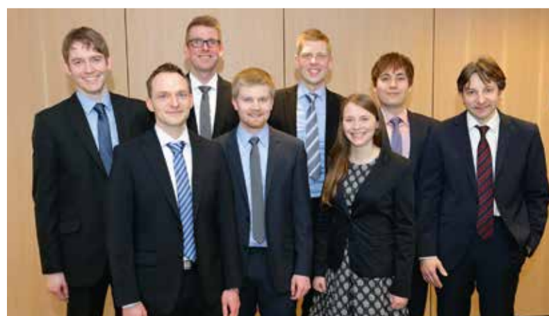
Insgesamt acht PreisträgerInnen wurden am 16. März bei der Verleihung des Hans-Uhde-Preises 2016 ausgezeichnet.

Sieben Absolventen der Fachhochschule und der TU Dortmund sowie ein Mitarbeiter der thyssenkrupp Industrial Solutions AG wurden am 16. März mit dem Hans-Uhde-Preis ausgezeichnet.