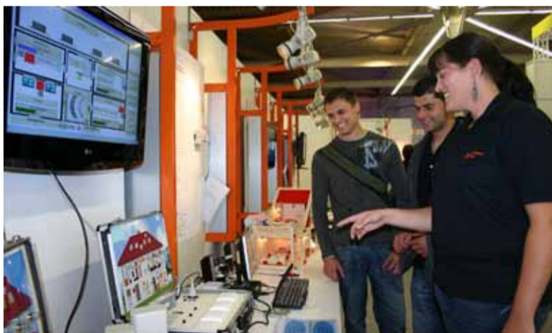
Mit Demonstrationssystemen zeigte das FH-Team auf der Messe, wie man mit moderner Gebäudesystemtechnik Energie einsparen kann.

Das Gesamtvolumen der Projekte liegt bei rund 1,2 Millionen Euro. 75 Prozent davon (877 400 Euro) werden aus Landes- bzw EU-Mitteln finanziert. 15 Prozent bringen die Projektpartner mit, zehn Prozent finanziert die FH.