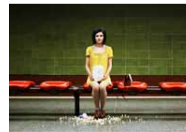
Alice im Wunderland inspirierte Modefotos - real oder surreal?

Fast alle hatten schon eine Geschäftsidee im Kopf: Wie sie diese künftig erfolgreich realisieren können, lernten 24 gründungsinteressierte Studierende und Alumni bei der Summer School „FHDurchstarter“ im August in Münster. Die Hälfte der Teilnehmer kamen aus der Fachhochschule Dortmund, wobei alle Fachbereiche vertreten waren. Eine Woche lang ging es bei diesem Mix aus Theorie und Praxis um den formalen Rahmen und unverzichtbares Know-how für die Existenzgründung: Fachreferenten vermittelten Kenntnisse in Buchhaltung und Marketing, Patentschutz oder Steuerfragen. Im Gegenzug stellten die Teilnehmer ihre Geschäftsideen zur Diskussion. Einzelne oder in Gruppen entwickelten die angehenden Existenzgründer Lösungswege für vorgegebene Aufgaben. Best-Practice Beispiele für erfolgreiche Existenzgründungen gehörten zum Anschauungsunterricht. „FHDurchstarter“ ist ein gemeinsames Projekt der Fachhochschulen Dortmund, Münster und Bielefeld. Wegen der großen Nachfrage planen die drei Hochschulen weitere Gründungswochen.