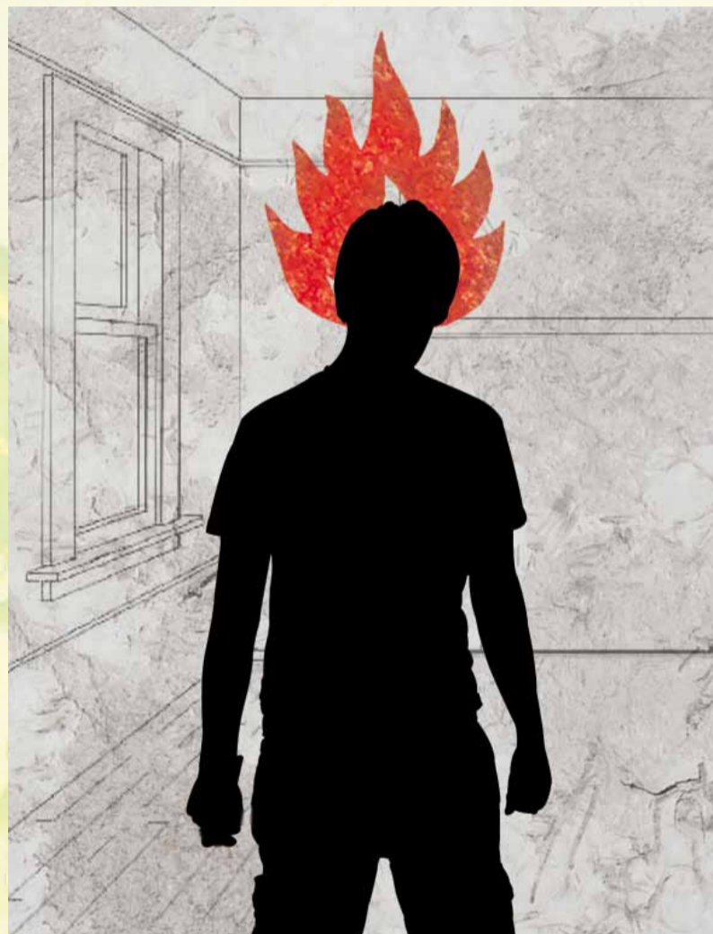
Immer mehr Studierende bleiben bei dem enormen Leistungsdruck auf der Strecke.

Natürlich gibt es auch Studierende, die einfach in den Tag hineinleben, doch genauso gibt es auch die, die sich richtig ins Zeug legen, um gut und zügig voran zu kommen. Die Anzahl derer, die ihr Studium ordentlich absolvieren möchten, steigt. Experten behaupten, die Hochschulreform macht vielen