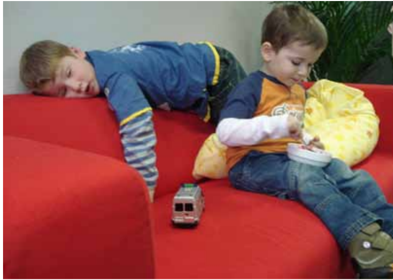
Spielen macht sooo müde und soo hungrig: Kinder in der FH-Betreuung.

In punkto Öffnungszeiten werde sich die Situation auf dem Campus auch für die Architektur mit dem Bibliotheksumbau in der Emil-Figge-Straße 44 verbessern. Rückgabeboxen - zunächst in den Bibliotheken Design und Ingenieurwesen - werden zum Semesterbeginn eine Rückgabe von Medien auch außerhalb der Öffnungszeiten ermöglichen. Zwischen März und Mai 2009 hatten sich insgesamt 824 Nutzer zu Stärken und Schwächen der Bibliothek geäußert. 93 Prozent der Teilnehmer waren FH-Angehörige, davon wiederum 97 Prozent Studierende, was einem Anteil von neun Prozent der aktiven Bibliotheksnutzer entspricht.