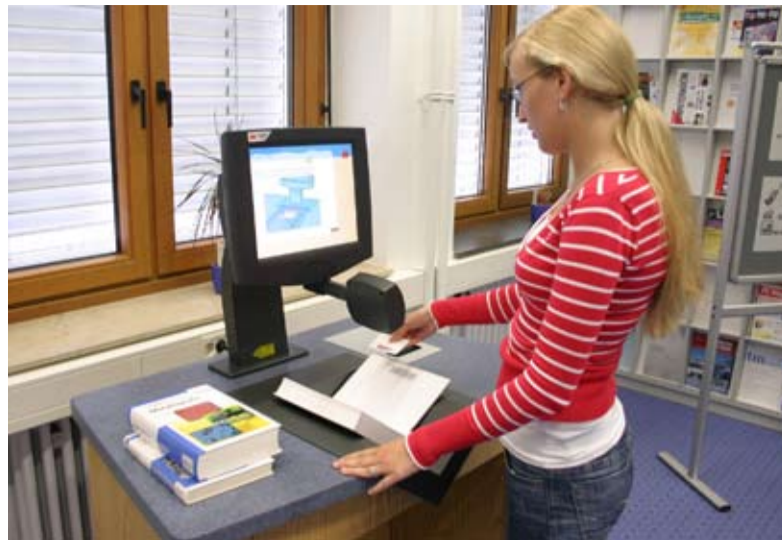
Selbst einscannen ist in der Bibliothek vor allem abends ein gefragtes Angebot.