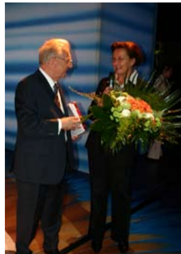
Dank an Ex-Ministerpräsident Lothar Späth, der als Referent aus Baden-Württemberg anreiste.