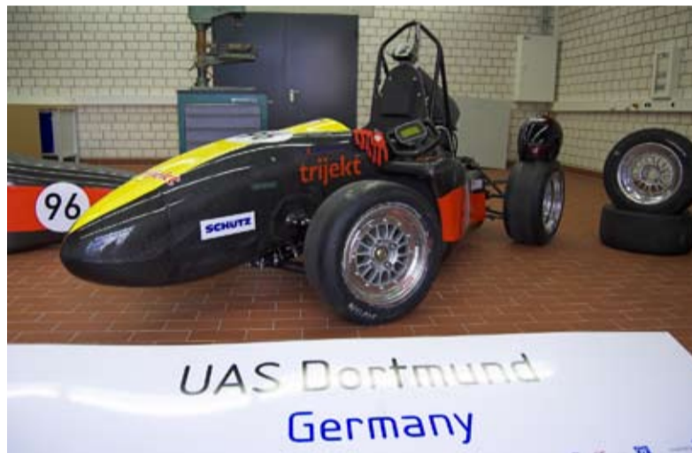
Im der Kategorie Design landete der Bolide des „Race-Ing“-Teams auf Platz 11 von 60 teilnehmenden Teams.

In Italien wollen die Dortmunder Studenten deutlich mehr erreichen. Zum Wettkampf gehören vier Rennen: Beschleunigungsrennen, Autocross, Endurance (Ausdauer) sowie ein Verfolgsrennen. Mit ihrem 240-Kilo-Boliden kämpfen sie um eine gute Platzierung im Mittelfeld. Der Vier-Zylinder-Motor sorgt für 80 – 90 PS, 600cm 3 Hubraum sind berechnet. Das Projekt wird durch Spenden und Sponsoring finanziert. Die Fachhochschule unterstützte die Studierenden, indem sie Werkstatt und Equipment zur Verfügung stellte. Lehrende und Mitarbeiter boten gern und zahlreich Hilfe an, erfahrene Werkstattmitarbeiter halfen bei Problemen weiter.