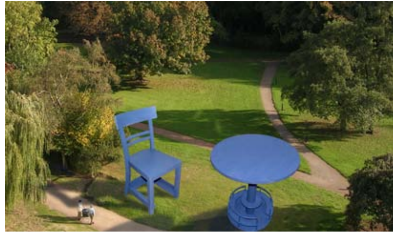
Diese Parkmöbel sind auch aus dem sechsten Stock des Krankenhauses noch gut sichtbar.