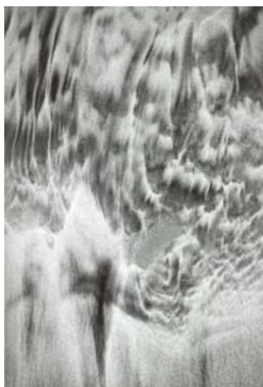
bilder“ in Schwarzweiß-Fotografien festgehalten. Motive, die in der Natur längst vom Winde verweht sind. Über

die Bearbeitung der Fotos, also etwa die Wahl des Bildausschnitts, die Gradation und Tonwertskala hat Prof. Adolf Clemens die Kontraste der Sandstrukturen noch stärker herausgearbeitet.